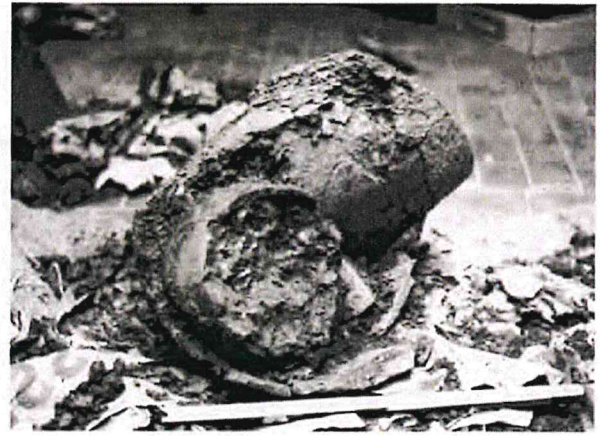
Villa Manodori. L'anfora contenente il cinerario ancora colmo di ossa bruciate.